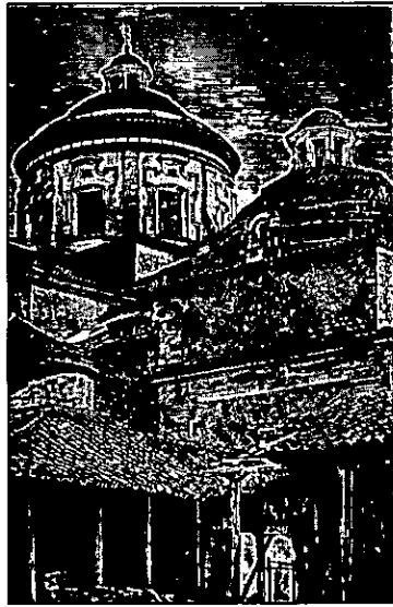
Iglesia de San Ignacio, grabado de Rodríguez y Barreto, 1885, Papel Periódico Ilustrado .

Esto último, le permite asegurar que, de la infinidad de papeles enviados, con distintos puntos y pretensiones, muchos los había dado a las llamas por no ser dignos de comunicarse, mientras que algunos verían la luz. Para ilustrar esta situación, resalta los méritos del que inserta que además de tratar un asunto de importancia “está expuesto con mucha energía y solidez”, refiriéndose al discurso sobre el “Bejuco del guaco”, una especie nativa con propiedades contra la picadura de serpientes, que ocupa la mayor parte del ejemplar y del siguiente. 40