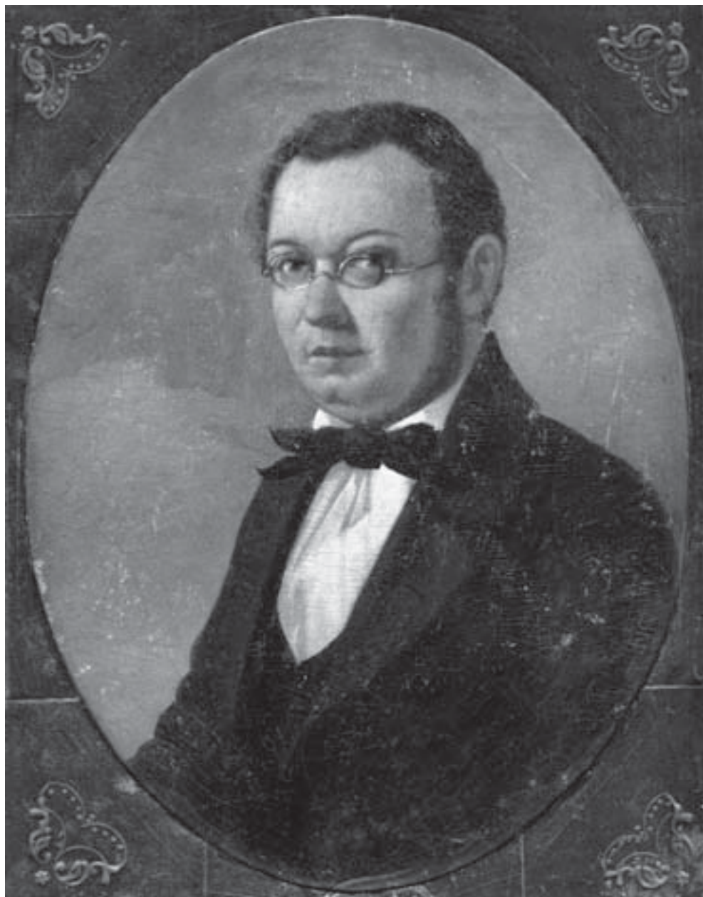
Портрет П.П. Ершова работы Н.Г. Маджи. Конец 1850-х гг. (Отдел рукописей РНБ – Санкт-Петербург).