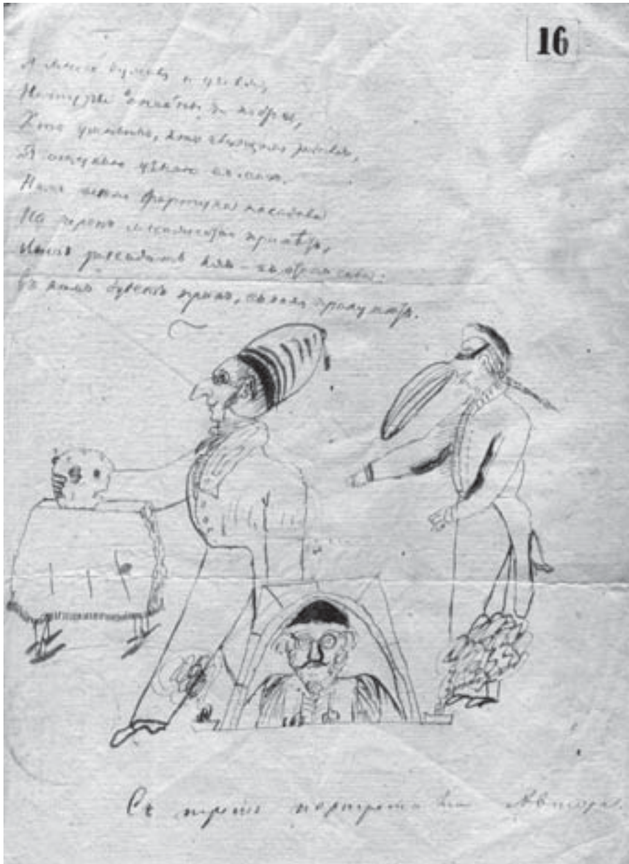
Рисунок и восьмистишие П.П. Ершова к водевилю “Черепослов, сиречь Френолог”. 1837 г. Отдел рукописей ТГИАМЗ.