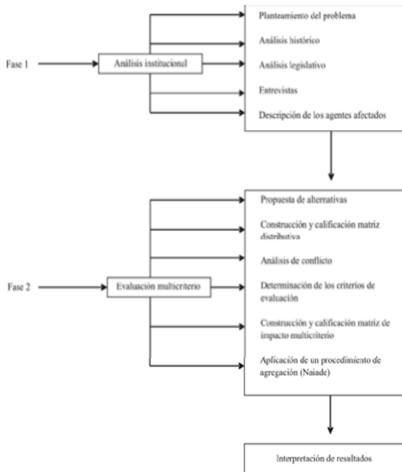
Figura 1. Proceso metodológico de la evaluación multicriterio social. Vargas (2003).

de campo, dirigida hacia la reconstrucción empírica de los procesos sociales, es decir, de las prácticas, los modelos de interacciones, los esquemas culturales a través de los cuales los actores articulan las relaciones sociales. Sólo de este modo, será posible investigar las preferencias efectivas o mejor los intereses del individuo y su percepción del problema en estudio (Ferrari, 1999).