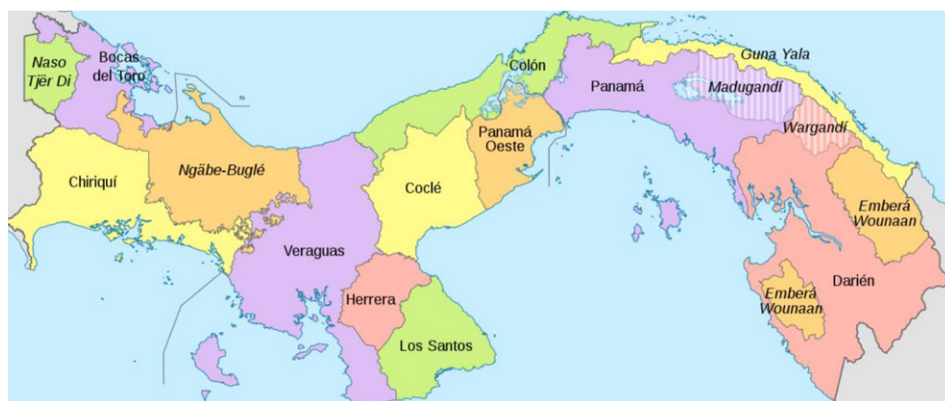
Figura 1. División político-territorial de Panamá*

* Las zonas rayadas corresponden a comarcas sin rango provincial.