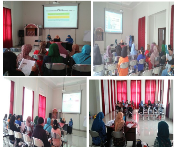
Gambar 3. Sosialisasi kepada Orang Tua Siswa PLA

Di Indonesia, hanya anak-anak autis tertentu yang mendapat perhatian lebih dengan diikutsertakan pada lembaga pendidikan autis dan sisanya masih belum diketahui.