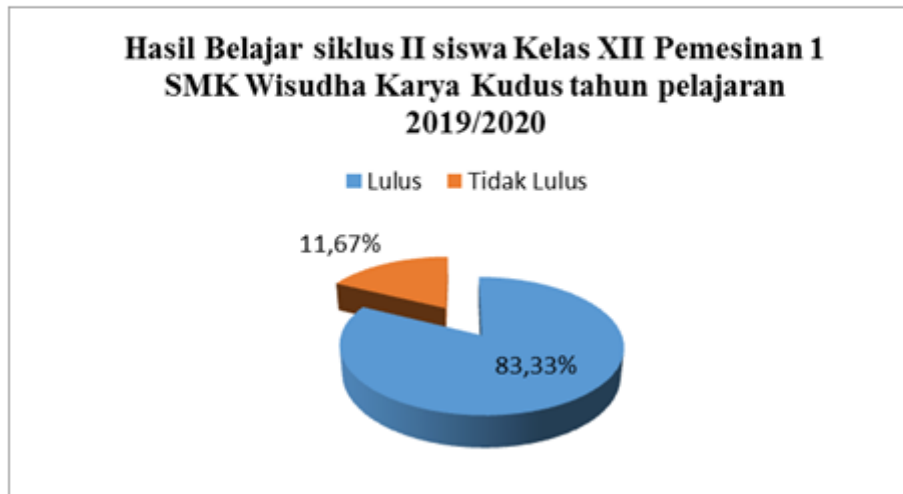
Diagram 3 Hasil Belajar siklus II siswa Kelas XII Pemesinan 1 SMK Wisudha Karya Kudus tahun pelajaran 2019/2020