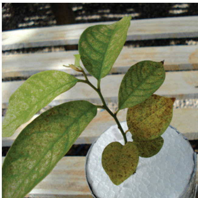
FIGURA 3. Planta deficiente em nitrogênio (-N) da biribá ( Rollinia mucosa ).

crescimento é subótimo, o crescimento é retardado, o N que está mobilizado nas folhas adultas é translocado para as mais novas, ocorrendo os sintomas típicos de deficiência, tais como o aumento na senescência das folhas mais velhas (Marschner, 1995).