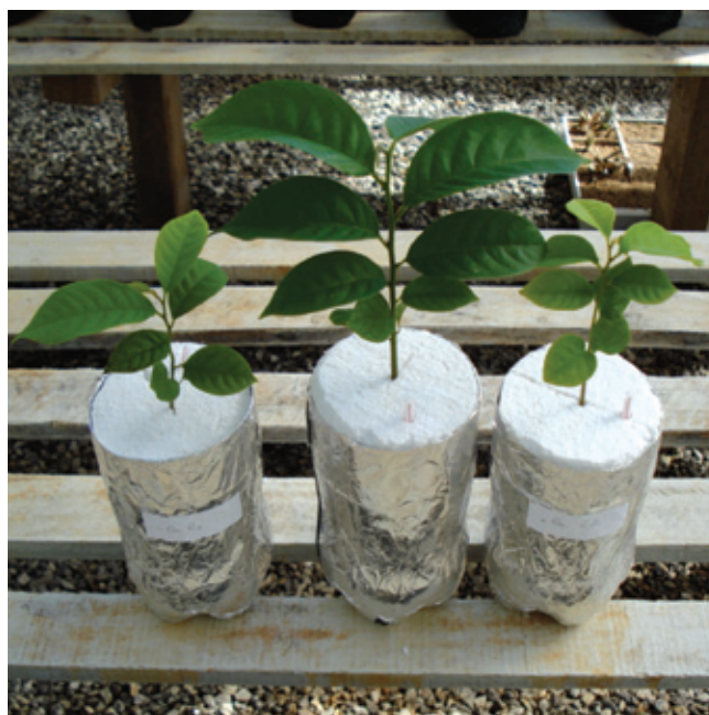
FIGURA 4. Plantas deficientes em cálcio (-Ca) e planta cultivada em solução nutritiva completa (SNC) da biribá ( Rollinia mucosa ).

Andrew, C.S. 1962. Influence of nutrition on nitrogen fixation and growth of legumes. pp. 130-146. Em: Commonwealth Scientific Industrial Research Organization. A review of nitrogen in the