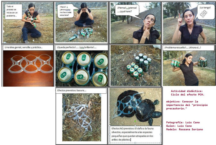
Figura 10. Actividad didáctica que relaciona con ejemplos familiares la relación entre I+D y el principio precautorio.