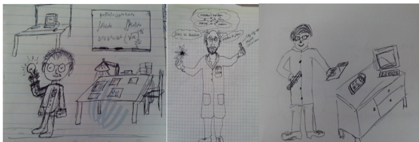
Figuras 6, 7 y 8

Todo esto se suma al hecho de que algunos puntos de los planes y programas de estudio se sitúan dentro de una visión muy cercana al positivismo lógico, la cual ha permeado también en los medios de comunicación, en los libros de texto y en otras fuentes de información, desde ya hace un buen rato. Según esta postura, ampliamente adoptada por los docentes de manera inconsciente pero generalmente desconocida en sus fundamentos, se considera que: