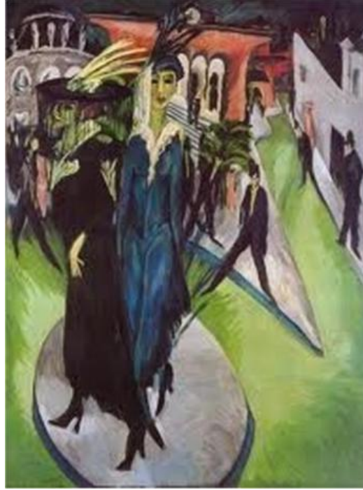
Resim 2: Ernst Ludwig Kirchner, “Postdamer Meydanı” 1914. Neue Nationalgalerie Berlin.

edindiği resimlerinde, adeta bu karmaşasıyla kent hayatının karmaşasını kadınların ruhsal durumlarının birbirine entegre etmiş gibidir.