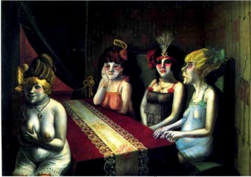
Resim 3: Otto Dix, 1927, Salon, Tuval Üzerine Yağlıboya, Galeri Staatsgalerie, Stutugart,Germany.

sakat askerlerin, yoksul dilencilerin ve müşterilerini bekleyen fahişelerin resimlerini de yapmıştır.