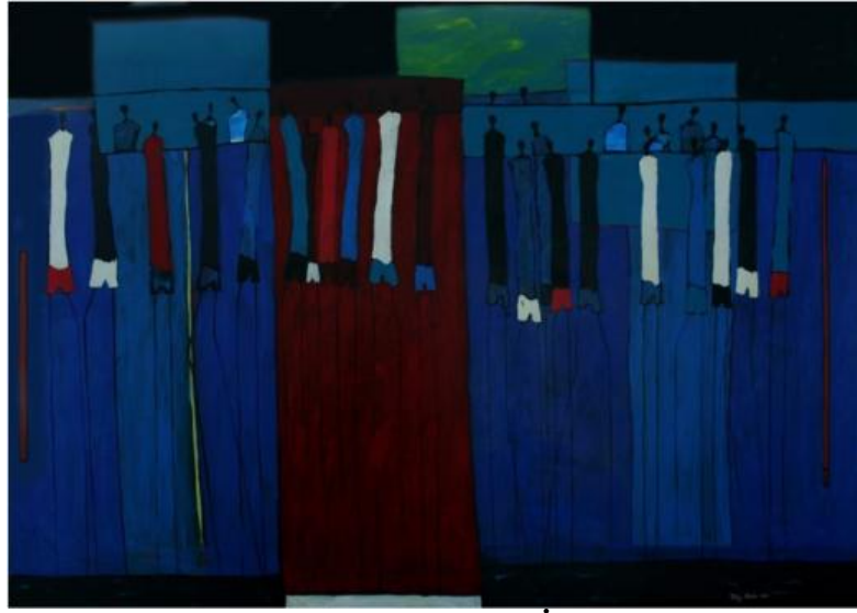
Resim 7: Tolga Akalın, “Modern Mekân İçlerinden” 160 x 120, 2014

resimdeki figürlerde sadece birbirlerine karşı değil, aynı zamanda buldukları mekanlara karşı yabancılaşmalar da söz konusudur.