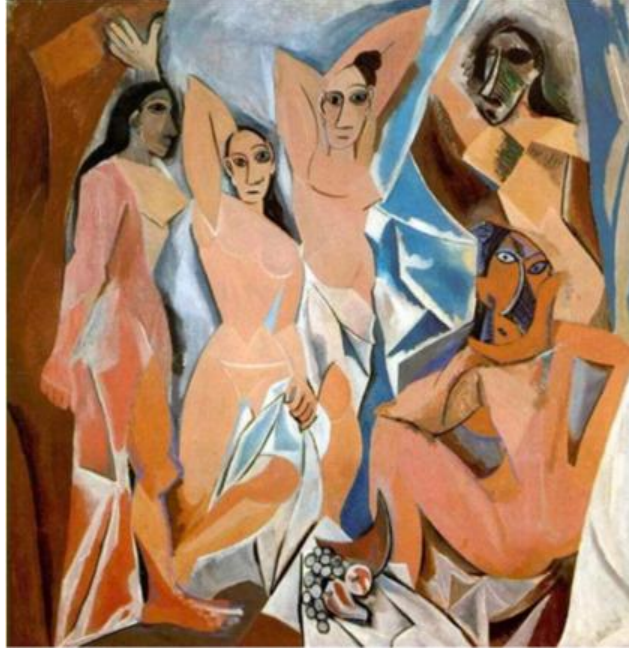
Resim 1: Pablo Picasso “Avignon’lu Kızlar” 1907 Museum of Modern Art, New York.

ettiği kentsel ve endüstriyel gelişimin sonuçlarını bu resim üzerinden anlattığı görülmektedir.