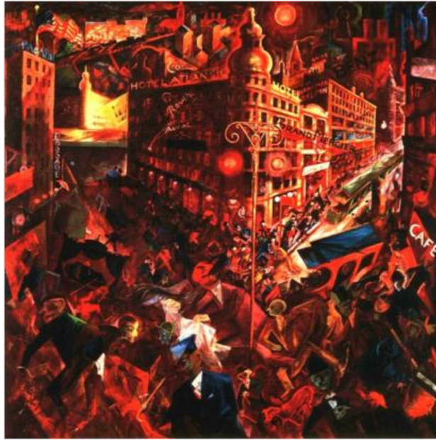
Resim 6: George Grosz, Metropolis, 1916, Museo Thyssen-Bornemisza, Madrid.

Sanatçının ifadesinden yola çıkarsak; aslında toplumsal gelişmenin ve bunun hızlı bir şekilde yayılmasının sonucu olarak insan ruhunda açtığı hiçlik duygusunun, kafa karışıklığının ve boşluğa düşme eğilimini rahatça görebiliriz. Bu duyguları sanatçının yapmış olduğu, şehir hayatının yoğunluğunu ve karmaşasını anlatan resimlerinde görmek mümkündür.