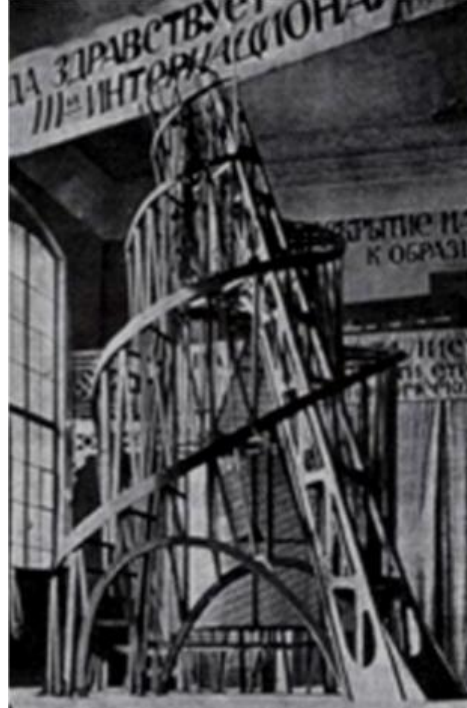
Resim 4: Vlademir Tatlin, 3. Enternasyonel Anıtı,1917-1920 Ahşap Maket.

kulesine rakip olarak düşündüğü '3. Enternasyonal Anıtı' ile tanınmıştır. Bu anıt resim, heykel ve mimarinin benzersiz bileşenlerinden oluşmaktadır. Anıt Rusya'nın maddi imkânsızlıklarından dolayı uygulamaya geçememiş ahşap maket olarak kalmıştır.