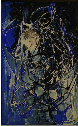
Resim 1. Hans Hofman, Rüzgar, Tahta Üzerine Guaj-Hint Mürekkebi-Yağ, 1942-1944.