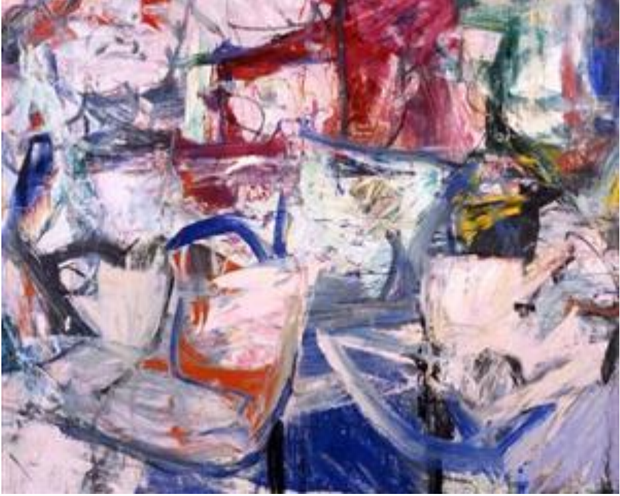
Resim 5. Willem De Kooning, Cumartesi Gecesi, 1956.

Franz Kline, 1950' li yıllarda geliştirdiği Doğu kaligrafisini anımsatan, beyaz bırakılmış zemin üzerine siyah fırça vuruşlarıyla, beyaz ve siyah rengi hacim ve biçim yaratmada ustalıkla kullanmıştır. Hareketli-soyut eserlerindeki siyah-beyaz hakimiyetinin yanı sıra farklı renklerde kullanmasına rağmen yaşamı boyunca siyah-beyaz üslubunu sürdürdüğü görülmektedir. Son dönem yapıtlarında ise fazlasıyla yalınlaştırılmış, dengeli kütlelerin sunulduğu eserlerle karşılaşılır (Eczacıbaşı Sanat Ansiklopedisi, 1997:1027). Bu üslubu uygularken büyük boyda ve kalınlıkta fırçalar kullanmış ve büyük tuvaler üzerinde çalışmıştır. Zaman zaman eserlerine, kaligrafileri çağrıştıran sıçratmalar eklediği de görülmektedir.