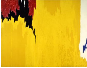
Resim 9. Clifford Still, Başlıksız, 1957.

Clifford Still, kendine özgü tavrını oldukça keskin ifade biçimleri sunan Geç Resimsel Soyutlama anlayışına hakim sanatçılardan bir diğeridir. Sanatçının resimlerindeki kırık çizgilerle sınırlandırılmış renkli alanlar, etrafındaki diğer alanlardan belirgin bir şekilde ayrılır. Çoğunlukla dikey olarak yönlendirilmiş tuvalerin yanı sıra yatay düzenlenmiş kompozisyonlarda bile resimlerdeki lekelerin yönlerinde yukarıdan aşağıya doğru bir kayma hareketi hissedilir. Temel olarak bir eskimişlik ve derinlemesine çatlamışlık etkisi veren kompozisyonların, kullanılan renklerle olan ilişkisine bakıldığında canlı ve taze renklerin seçilmiş olmasındaki tezatlık dikkat çeker. Sanatçının resimlerini düşsel temalar üzerine yapılandırdığı bilinmektedir.