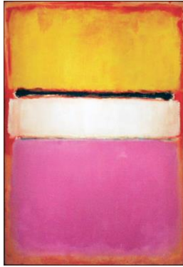
Resim 8. Mark Rothko, Beyaz Merkez, 1950.