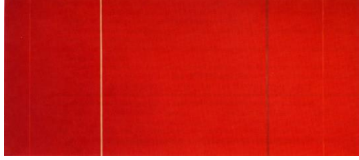
Resim 10. Barnett Newman, Vir Heroicus Sublimus, 1950-51.