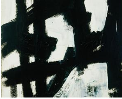
Resim 6. Franz Kline, New York, 1953

Robert Motherwell ise sanat tarihi, felsefe ve estetik konularında oldukça bilgili; dergi ve kitaplar yayımlamış bir sanatçıdır. Amerikan sanatçılarının entelektüellik karşıtı tavırlarını ve modern sanatçıların yıldızlaştırılıp, ayrıcalıklı bir yere konulmasını eleştirmiştir. Modern sanatçıların bir çeşit “ruhsal yer altı”nda yaşadığını düşünen sanatçının bu ifadesinin nedeni, modern çağın getirdikleri ile birlikte dinin etkisinin zayıflaması olarak görülmektedir (Yılmaz,2006:168). Sanatçının Fransız kültürüne ve özellikle Sürrealizm’e ilgi duyduğu, resimlerinde ise tam olarak hüznün olmasa da, ciddi bir karşı çıkma ifadesi sezildiği düşünülmektedir.