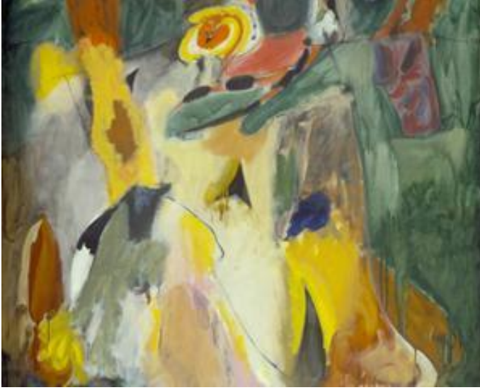
Resim 3. Arshile Gorky, Şelale, 1943.

Soyut Dışavurumcu eserlerin ortak noktası, Gerçeküstücü sanatın temel ilkelerinden olan çağrışımlar ve özdevinimden yola çıkmalarıdır. Çağrışımlarla bilinçaltı özgür kılınmış yapıt, bir ön düşünce ya da tasarım olmadan, çağrışımların getirdiği anlık düşüncelerle biçim bulmuştur. Bu biçimler genelde güzel lekeler gibidir, insancıl ve duygusal değerler vurgulanmıştır. Resim parçalara ayrılmayan, önceden tasarlanmayan, sınırları bulunmayan tek ve bütüncül bir imge olarak ortaya çıkmaktadır. Tuvalin sınırları aşılarak, özellikle devasa panolar üzerine çalışılmıştır (Eczacıbaşı Sanat Ansiklopedisi,1997:1688).