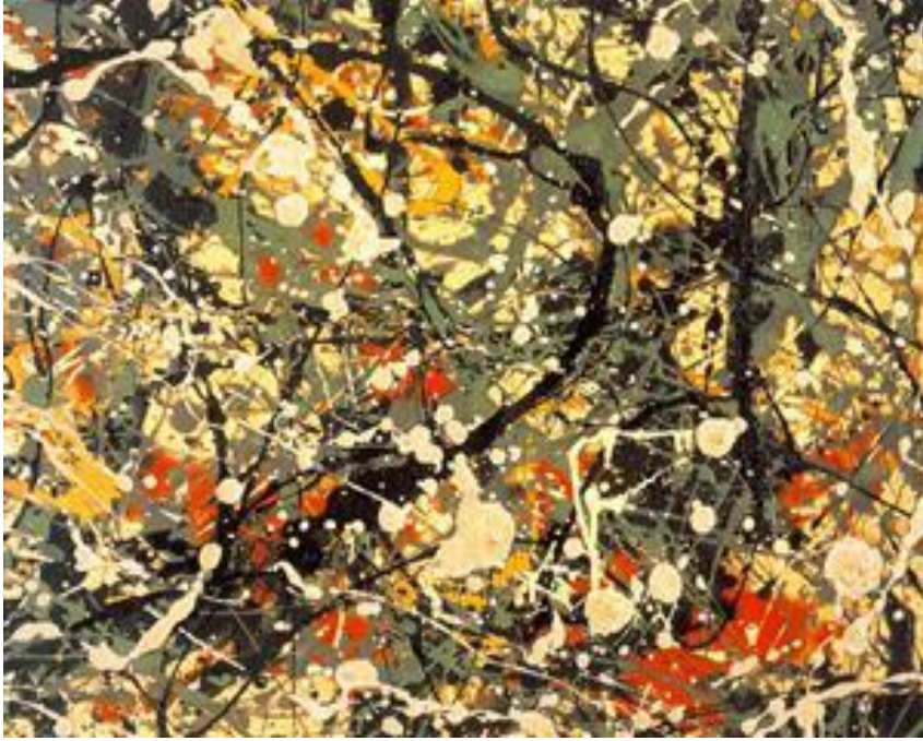
Resim 4. Jackson Pollock, No:8, Eserden Detay, 1949.

Pollock'un damla stili, teknik olarak ilk defa uygulanan bir buluş değildir. 1920'li yılların ortalarında Sürrealist'ler de boyayı akıtarak veya sıçratarak deneysel bir şekilde yüzeye uygulamışlardır. Ancak Pollock'un resimlerinin diğerlerinden ayrılma sebebi, tekniği kullanma şekli ve resimde devrim olarak sayılan bu yaklaşımı biçimlendiren düşünceleridir (Fineberg,2014:97). Ayrıca sanatçının resimlerinin birçoğuna isim verirken numaraları tercih ettiği de bilinmektedir.