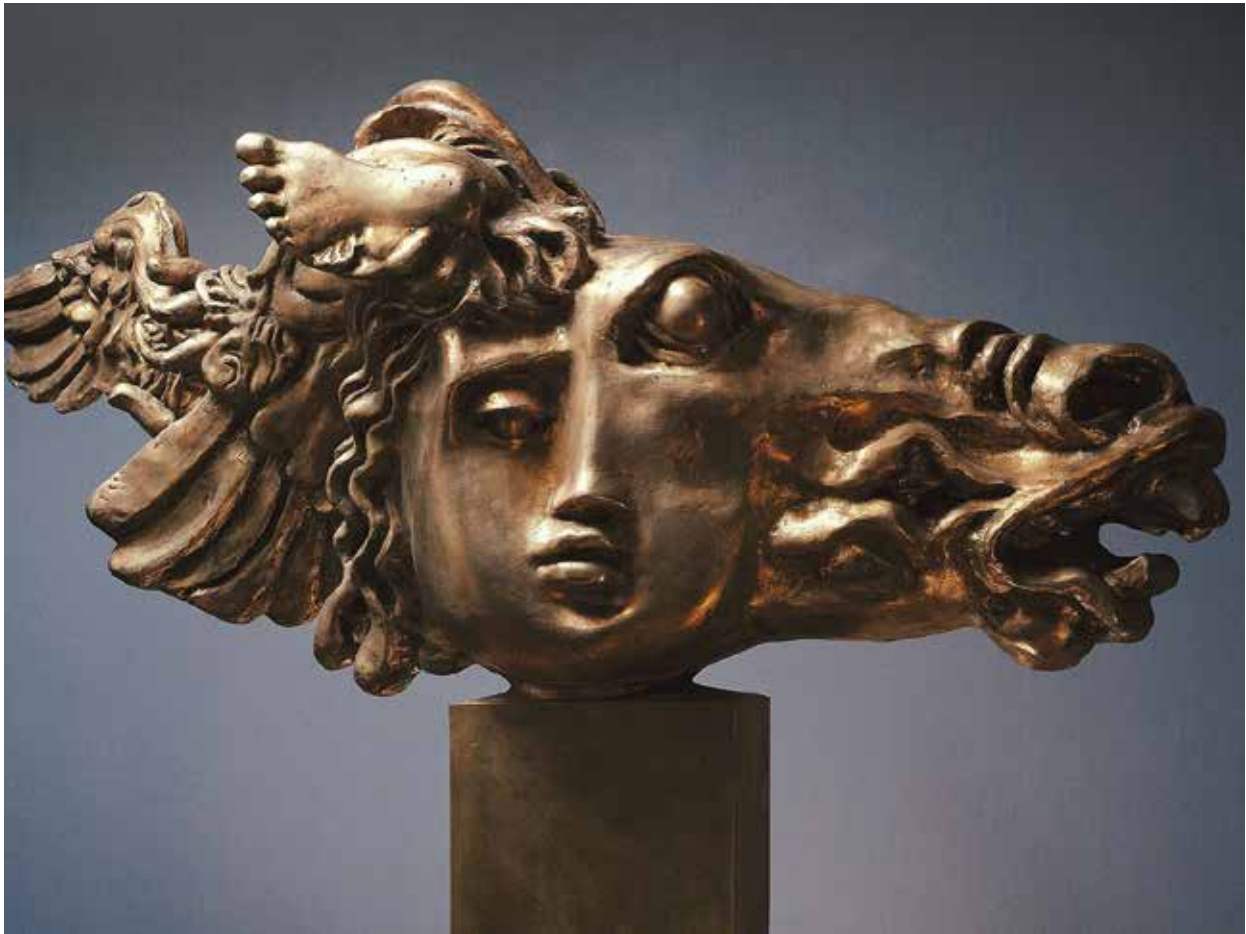
Alexander Burganov. Medusa . 2008. Red wood

In most works, intrigue is preserved, visual images do not allow the audience's consciousness to be adequately realized in the commentary word, in the detailed determination. "Life situation", "psychopathology of everyday life", or, more impressive, - "national idea"... - Burganov creates in another dimension. Invisible concepts, containing deeper meanings, are embodied in reality. And Burganov's "legends and myths of Ancient Greece" are by no means illustrations of such; they are rather very personal experiences, a sensory reaction to the subconsciously archetypal. The choice of such (from the multitude) is, in fact, an artistic message and it forms the basis for understanding the nature and mentality of our sculptor.