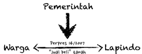
Bagan .I. Relasi aktor berbasis tanah “dalam peta”

Transaksi tanah di “dalam peta” menjadi sangat rumit untuk diurai karena tidak hanya melibatkan aktor-penjual (warga) dan aktor-pembeli (Lapindo), tapi juga aktor-pengatur (pemerintah). Seperti dibahas pada bagian sebelumnya, bentuk dan besaran “kompensasi” bagi korban Lapindo merupakan turunan dari kalkulasi spontan Wakil Bupati Sidoarjo, Saiful Ilah, untuk membeli tanah dan bangunan dua belas warga Jatirejo guna membangun tanggul. Model jual beli dan nilai tukar aset itu diadopsi warga untuk mendesak Lapindo untuk mengompensasi mereka atas kelalaiannya. Legitimitas atas transaksi tanah “dalam peta” adalah Perpres 14/2007, yang secara sederhana dapat diilustrasikan seperti berikut: