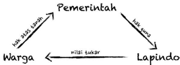
Bagan .2. Proses perubahan status tanah “dalam peta”

berubah menjadi “tanah negara.” Dengan demikian, Perpres 14/2007 membuka peluang bagi beragam tafsir hukum dan sosial atas apa yang dimaksudkan “Lapindo membeli tanah dan bangunan dari warga.” Pada 24 Maret 2008, BPN Pusat menerbitkan petunjuk pelaksanaan yang merinci alur mekanisme jual beli tanah “dalam peta” berdasarkan status tanah (tanah hak milik, tanah yasan/letter c/petok d/gogol, hak guna bangunan, dan aset pemerintah pusat/daerah). Dalam setiap alur itu disebutkan bahwa setelah terjadi ikatan jual beli status tanah akan menjadi “tanah negara” dan kemudian pemerintah akan memberikan “hak guna bangunan” pada Lapindo atas tanah tersebut (lih. Bagan 2).