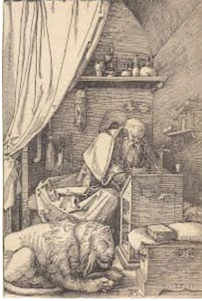
Resim 3. "Gravür", 1514

Çalışmalarında Saint Jerome, Alman sanatçı Albrecht Dürer'in 1514 gravürüdür. Saint Jerome masasının arkasında oturan, işe dalmış olarak gösterildi. Köşesinde haç olan masa Rönesans'ın tipik bir örneğidir. Eserde resmin türü olarak iç mekan ve figüratifdir. Perspektif başarılı bir şekilde yansıtılmıştır. Bu eserde ışık ve ton etkilidir.