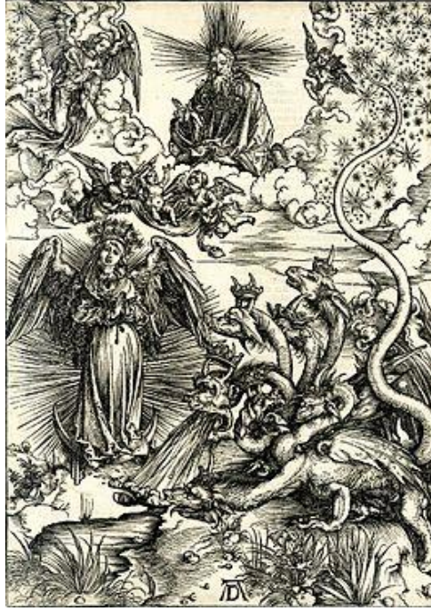
Resim 4. "Kıyamet", 1498

Çalışmalarında Saint Jerome, Alman sanatçı Albrecht Dürer'in 1514 gravürüdür. Saint Jerome masasının arkasında oturan, işe dalmış olarak gösterildi. Köşesinde haç olan masa Rönesans'ın tipik bir örneğidir. Eserde resmin türü olarak iç mekan ve figüratifdir. Perspektif başarılı bir şekilde yansıtılmıştır. Bu eserde ışık ve ton etkilidir.