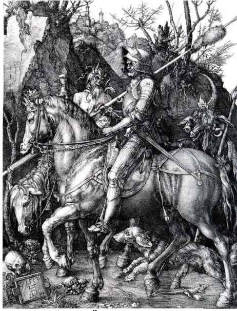
Resim 2. "Ölüm ve Şeytan", 1513

Gergedan, Albrecht Dürer tarafından 1515 yılında yapılan bir gravür çalışmasıdır. Resmin üzerinde bir tasvir bulunmaktadır ve bilinmeyen bir Hint sanatçı tarafından güldürü yazısı da yazılmıştır. Resmin türü olarak figüratif bir unsur görülmektedir. Çizgi ve ton bakımından başarılı bir şekilde yansıtılmıştır. Işık ve gölge eserde görülmektedir. Denge, yön ve biçim olarak bütünlük sağlanmaktadır. Estetik obje-süje ilişkisi ve estetik değer-yargı ilişkisi kurulmaktadır. Sanatçı ortaya bir sanat eseri ortaya koyarak, bu esere değer atfedebilir ve yargıda bulunabiliriz dolayısıyla sanatseverin estetik çözümlemeye nasıl bir ilişki kuracağı kişiden kişiye göre değişkenlik gösterir.